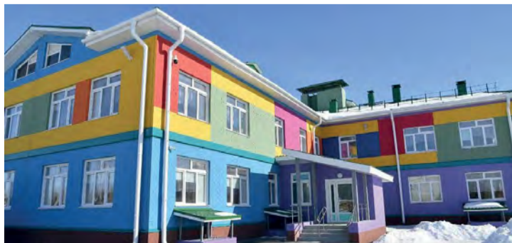
Детский сад комбинированного вида «Иртышский» начнет принимать ребятшек уже весной этого года.

В итоге специалистами полностью отремонтирована кровля, входная группа и фасад. В здании установили современную систему освещения, оповещения и вентиляцию. Уроки технологии у девочек теперь проходят с использованием новейшего швейного и кухонного оборудования, а у мальчиков – на современных технических станках. Во всех учебных кабинетах установили раковины и батареи с терморегуляторами. Отремонтировали столовую, пищеблок, спортивный зал и раздевалки. Появился в школе и центр детских инициатив, где ребята могут реализовать себя во внеурочной деятельности.