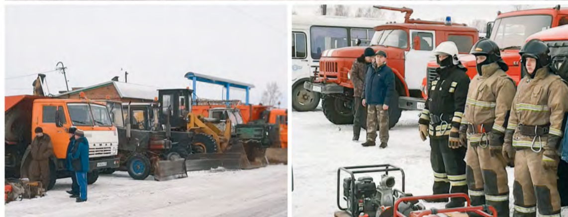
10 марта прошел смотр готовности сил и средств Тарского муниципального звена единой государственной системы предупреждения и ликвидации чрезвычайных ситуаций к весеннему паводкоопасному периоду и пожароопасному сезону 2023 года. Более десяти организаций Тарского района представили свою технику, которая может быть использована в случае ликвидации ЧС.