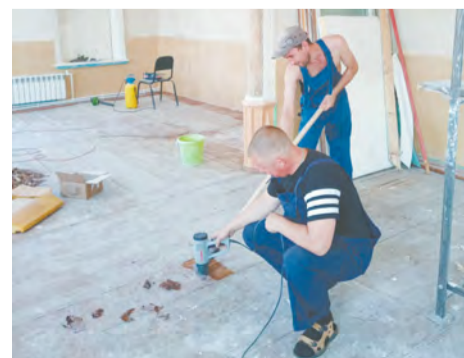
Материалы полосы подготовил А. СЕРГЕЕВ

Стоит отметить, что в каждом случае необходимое софинансирование из местного бюджета составит всего 1% от выделяемой нам суммы.