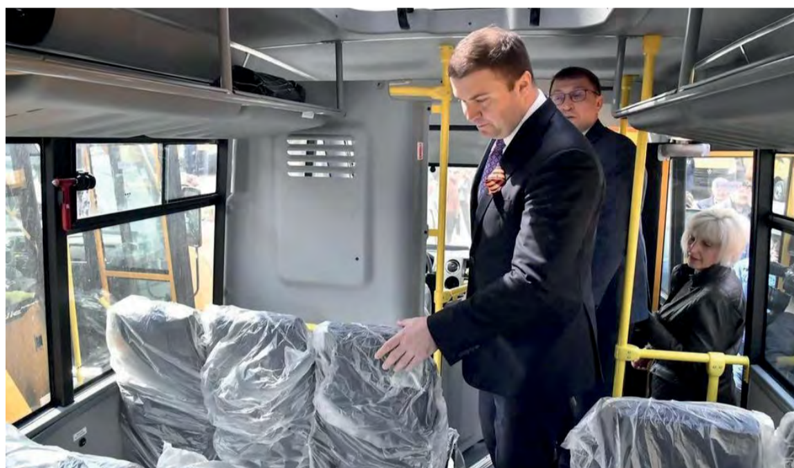
Стартовала программа масштабного обновления общественного транспорта в районах области.