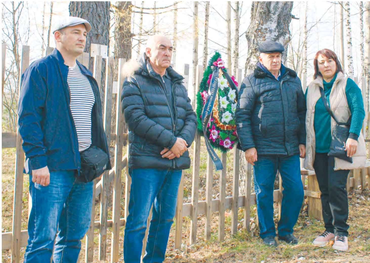
Наши гости из Карачаево-Черкесии на кладбище бывшей деревни Средний Имшегал (Красный Черкес).

На прошлой неделе в нашем районе побывали представители Карачаево-Черкесской Республики, чьи родственники 90 лет назад были насильственно выселены советской властью на север Тарского округа.