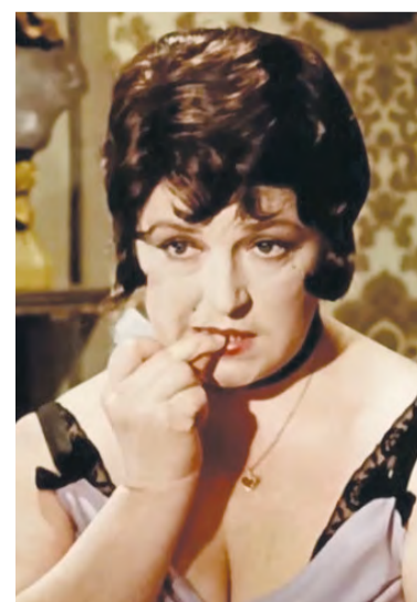
Материалы полосы подготовил Андрей КАЗАКОВ

А героиня нашей публикации продолжает общение с «американцем». Зачем она это делает? На что надеется? Возможно, в ее разбитом сердце еще теплится надежда, что мужчина передумает и отправится в дальнюю дорогу, чтобы, преодолев тысячи километров, прильнуть к ее устам.