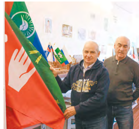
В числе экспонатов музея Атирской школы - три флага: абазинский, черкесский и Карачаево-Черкесской Республики, символизирующие тесную связь между сибиряками и жителями Кавказа.

Разве женщины, дети, старики представляли для советской власти какую-то опас-