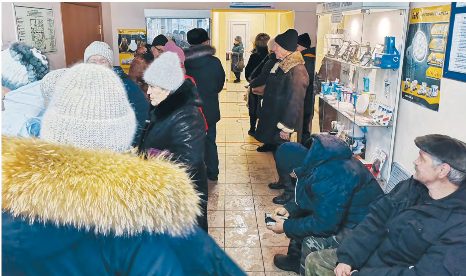
В офисе энергосбытовой компании большая очередь: на оплату счетов за электроэнергию и ТКО нужно потратить не менее часа. Несмотря на то что сегодня оплатить услуги можно в банке или через интернет, тарчане предпочитают делать это именно в кассе предприятия. По их словам, здесь не взимается комиссия и на квитанции остается отметка об оплате.