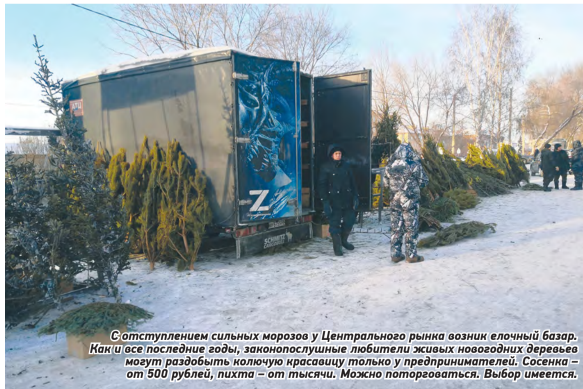
С отступлением сильных морозов у Центрального рынка возник елочный базар. Как и все последние годы, законопослушные любители живых новогодних деревьев могут раздобыть колючую красавицу только у предпринимателей. Сосенка – от 500 рублей, пихта – от тысячи. Можно поторговаться. Выбор имеется.