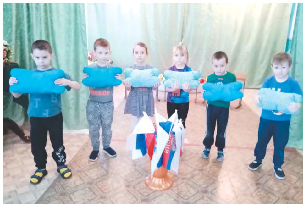
В Екатеринбургском детском саду дети помогают изготавливать подушки для раненых бойцов.