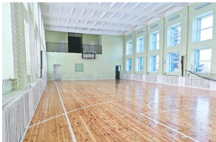
Спортивный зал для занятий баскетболом и волейболом до и после ремонта.