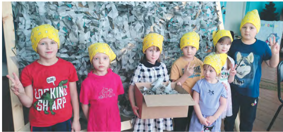
Дети из волонтерского отряда «Лучики добра» (с. Ложниково) освоили плетение антидроновых штор.

Поддержку нашим землякам, участникам спецоперации, оказывают волонтеры самых разных возрастов, в том числе и воспитанники детских садов.