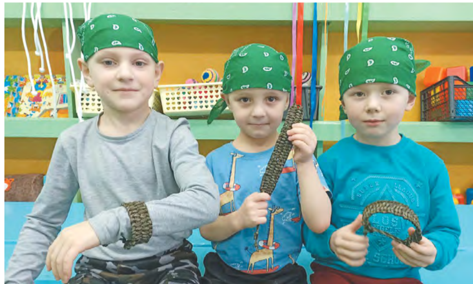
Воспитанники Литковского детского сада первыми стали плести браслеты для выживания.

По данным комитета по образованию, все дошкольные учреждения вносят сильный вклад в поддержку бойцов. Такой патриотический порыв детей не оставил равнодушными и взрослых. Они активно подключились к этой деятельности и стараются не отставать от ребят. Например, воспитанники детского сада №3 г. Тары и их родители с первых дней организации в нашем городе волонтерского движения, направленного на поддержку бойцов, собирают деньги для